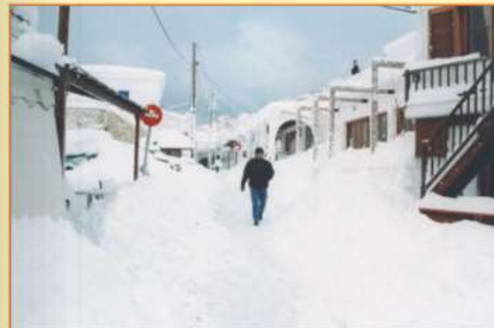
Στην κατάλευκη Σκύρο οι κάτοικοι με δυσκολία βγαίνουν από τα σπίτια τους.

Ευτυχώς μετά τη Δευτέρα ο καιρός γύρισε σε νοτιά και το χιόνι έλιωσε χωρίς να παγώσει.