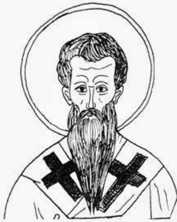
Βασίλειος ο Μέγας