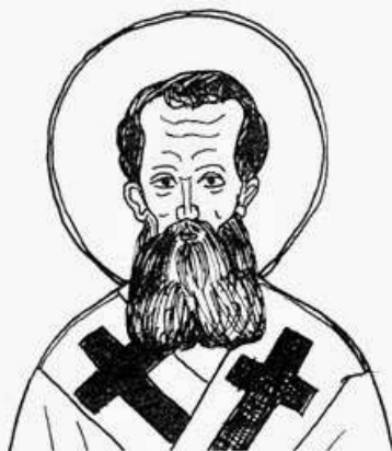
Γρηγόριος ο Θεολόγος