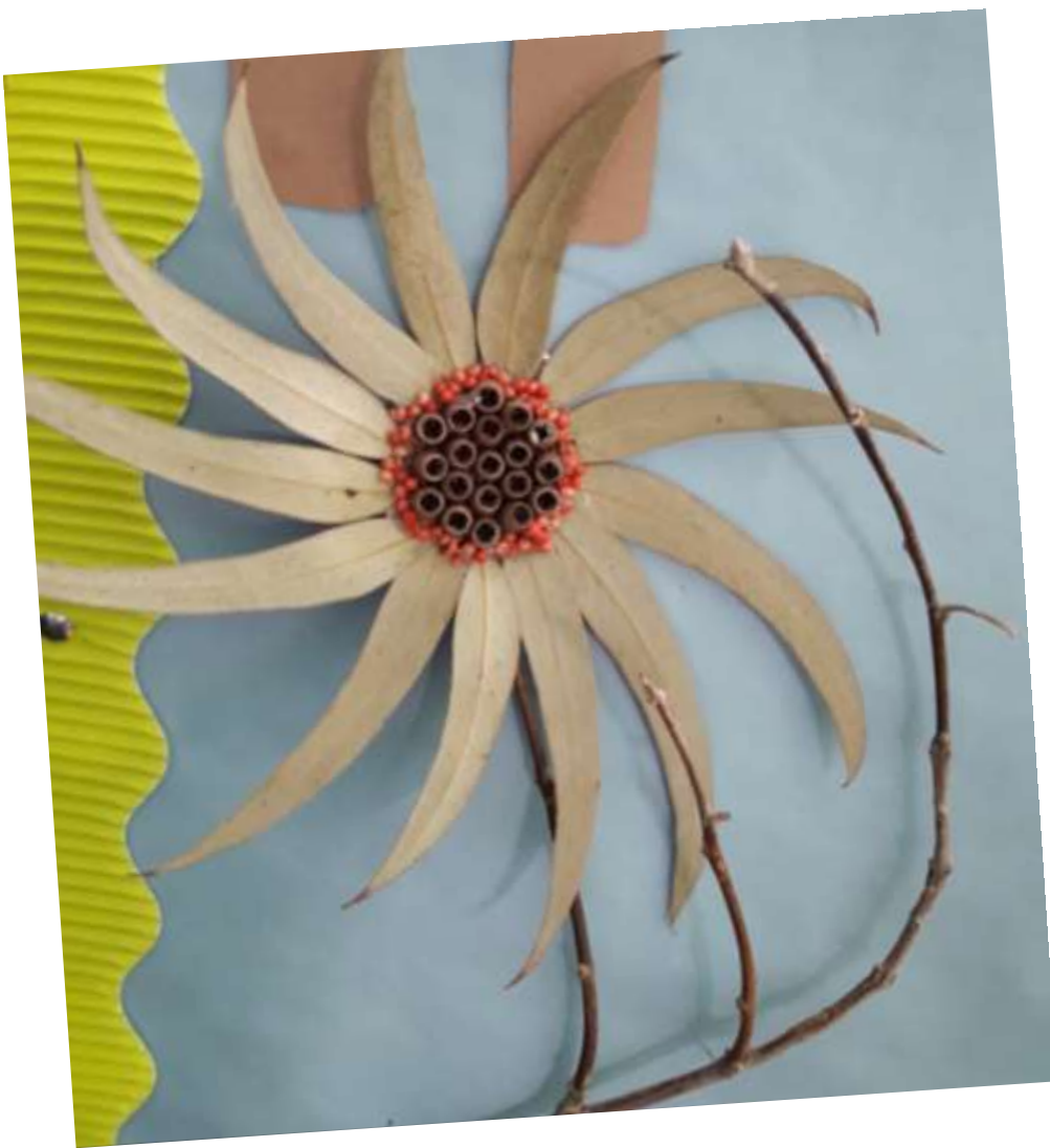
Λουλούδια : φτιαγμένα από φύλλα και καρπούς ευκαλύπτου.